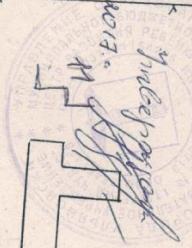
СХЕМА ФУЗ. ОБОРУДОВАНИЯ МЕДОУЧРП ДЕТСКОГО САДА №112